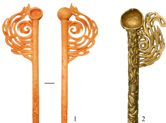
Рис. 3. Раннесакский культурный комплекс.

1 – костяная шпилька из кургана № 3 могильника Байке-2. Центральный Казахстан; 2 – золотая шпилька из кургана Аржан-2. Тува