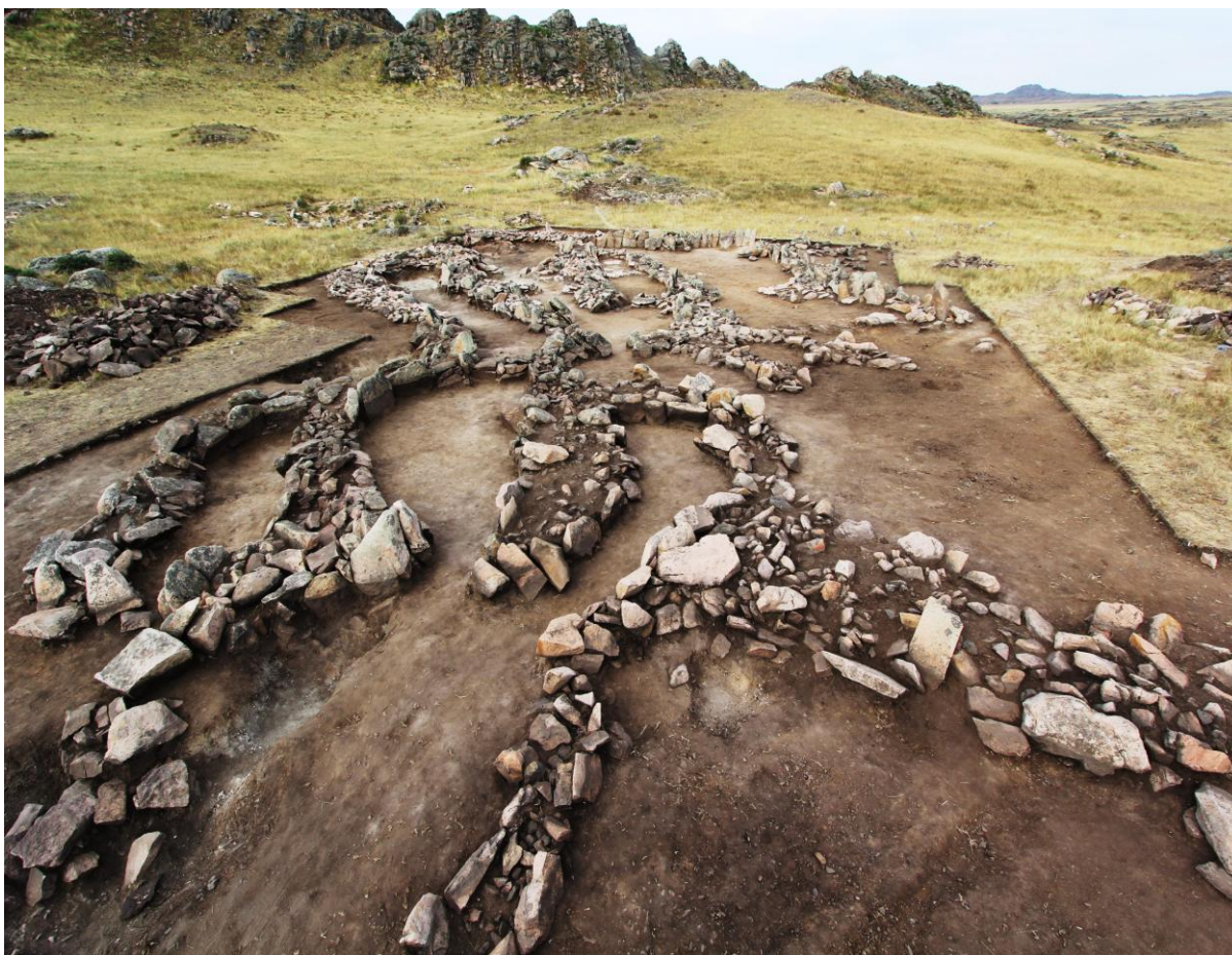
Рис. 1. Поселение Керегетас-2.